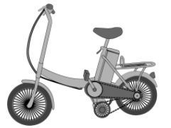
電動アシスト自転車

平成23年度に引き続き、平成24年度も電動アシスト自転車購入費補助を実施しています。地球温暖化防止及び渋滞緩和などの都市交通対策の一環として、電動アシスト自転車利用を積極的に支援することにより、人・まち・地球を大切にす都市交通を実現するための事業です。 ・補助金額…購入費の1/3以内(100円未満切捨て)・補助限度額2万円(1世帯1台まで) 【申込み・問合せ先】企画政策課政策グループ(62-1111代)