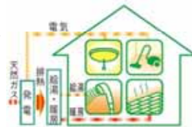
燃料電池システム

従来までの住宅用太陽光発電システムに加え、家庭用燃料電池システムを設置される方を対象に、設置費の一部を補助します。事前着工は認められませんのでご注意ください。 ・対象…自ら居住する町内の住宅に対象システムを設置する方(税を滞納していないこと) ・補助金…太陽光発電システム 1kW当たり30,000円 上限 4kW:120,000円…100件分 燃料電池システム 一台 定額 15,000円…10件分 ・受付…平成24年4月4日(水)から受付中 申請受理は、予算の範囲内で先着順となります。 【申込み・問合せ先】環境課環境保全グループ(62-1111代)