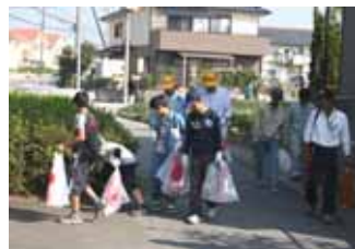
「ゴミ拾いウォーク」