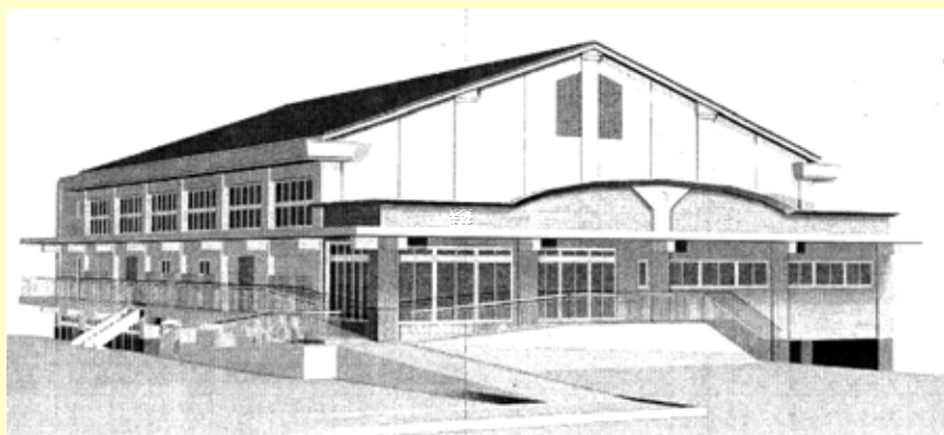
中央小学校体育館 完成予定図