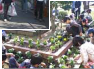
「花の苗植栽」 花壇づくり

今回は「あいち森と緑づくり事業」の一環の行事となり、10月末にも関わらず、汗ばむほどの秋晴れの中、新鮮な空気を吸いながら、気持ちの良い汗を流すことができました。皆さん、お疲れ様でした。