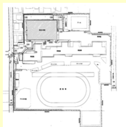
中央小学校レイアウト