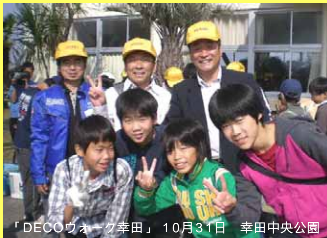
「DECOウォーク幸田」 10月31日 幸田中央公園

政権交代も実現し、自己決定・自己責任の「地方主権」時代が本格化してくるものと思います。これに伴い地域住民を代表する地方議会の役割は今まで以上に高まるものと考えています。「さらに住みよい魅力ある幸田の町づくり」に向け、一層の努力をして参ります。