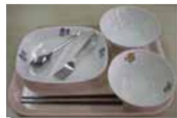
<新たに用意される食器>