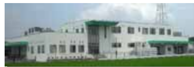
<完成間近の給食センター>

給食センターの移転に伴い、施設の住所が変更になります。H21年7月22日竣工式。2学期から給食3,800食/日の供給が始まります。（最大供給能力：5,000食/日）（3種類の食器を強化磁器製に。先割れスプーンを改め、スプーンとフォーク、プラ製のはしを用意。）