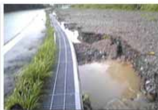
溢れ出た水で削りとられた路面