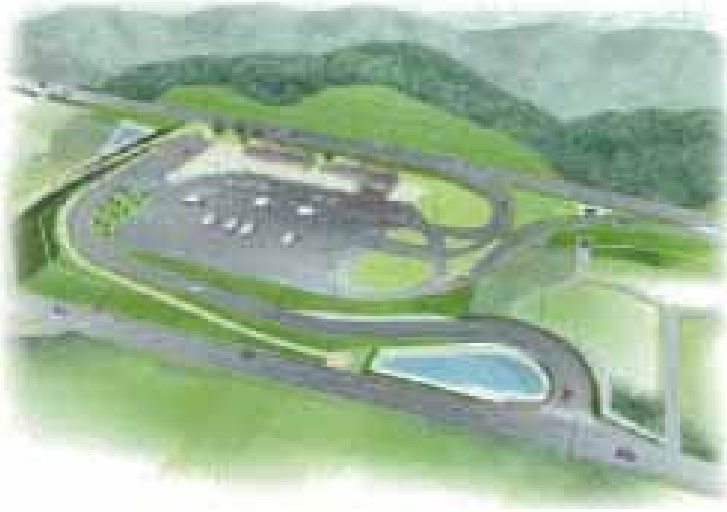
道の駅「筆柿の里・幸田」の完成イメージ

国道23号バイパスの須美ICと桐山IC間に建設中の道の駅の名称が「筆柿の里・幸田」に決まりました。