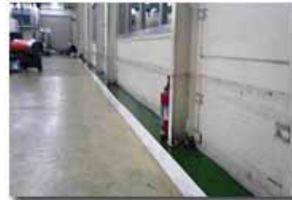
水位の後が残る工場のカベ