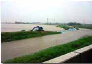
目の前に迫る増水した広田川

実施：平成21年1月25日(日)「新春駅伝・ファミリージョギング大会(新コース 約10.8km)」 予定通り実施。