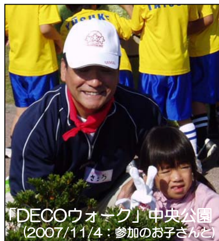
「DECOウォーク」中央公園 (2007/11/4：参加のお子さんと)

皆様には、平成20年の新春をさわやかにお迎えのこととお慶び申し上げます。平素は、格別のご理解と温かいご支援を賜り心から厚くお礼申し上げます。さて新年を迎え、時代が大きく変革するなかで柔軟で多様な視点を持ちながら、「活力ある町づくり」を皆様と共に進めていきたいと思っております。「住みよい魅力ある町づくり」に一層の努力をしていきます。新しい年が皆様方の幸多い年となりますよう心から、ご祈念いたします。