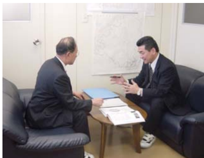
成瀬町議と意見交換