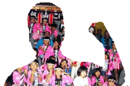
地元の祭りで「チャボコ太鼓」の子供達と