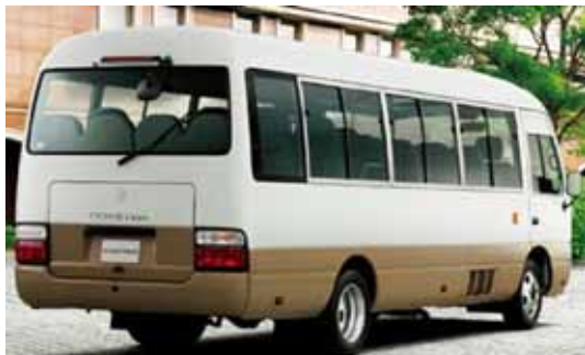
2台購入される同タイプ(29人乗り)の車両