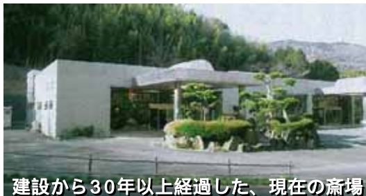
建設から30年以上経過した、現在の斎場