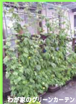
わが家のグリーンカーテン

ツル性植物で作る、自然のカーテンづくりに挑戦してみませんか。夏の暑い日に、葉っぱの間をすり抜けてくる涼しい風は天然のエアコンのようです。私も、ゴーヤのカーテン作りに挑戦しています。毎朝水をやり、順調に育っています。