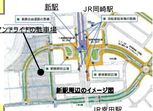
新駅周辺のイメージ図