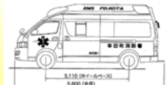
災害対応特殊救急自動車