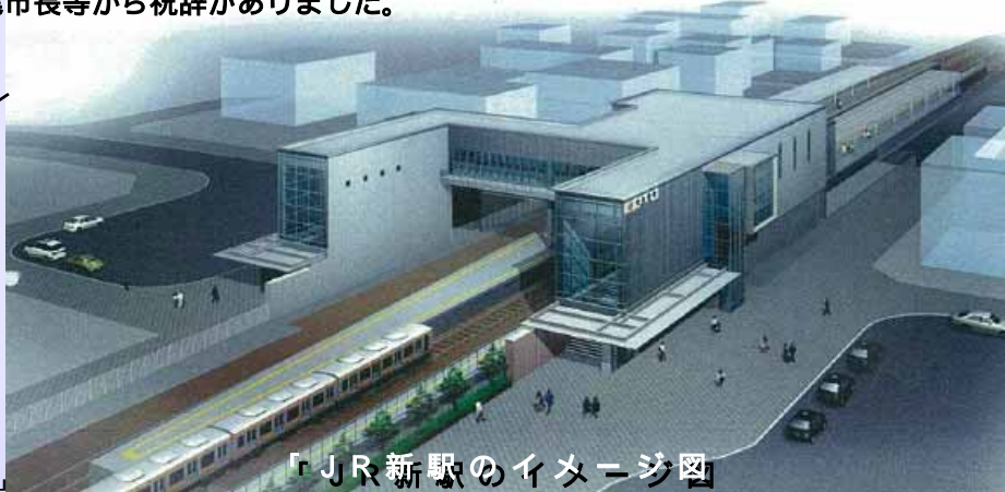
「JR新駅のイメージ図」

新駅には、公共交通の利用促進、低炭素型の都市構造実現に向けた拠点的作用も期待されています。