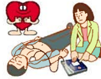
「使えるように講習を」

AEDは、コンピューターによって心臓のリズムを調べ電気ショックが必要かどうかを判断する機械で、救急現場で一般の人でも、簡単に安心して行うことができるように設計されています。