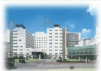
24時間365日対応 2次緊急医療総合病院

現在、岡崎市民病院では、年間9,000台を超える救急搬送が集中し、幸田町及び岡崎市南部では、年間約2,000人が、市町外の病院に救急搬送されています。新病院は質の高い救急医療を提供します。場所は、JR岡崎駅から徒歩約10分。総建設費は200億円。両市町負担金50億円のうち、新年度、幸田町は約7億7,500万円を負担する予算案を計上。