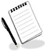
幸田町 平成31年度 当初予算