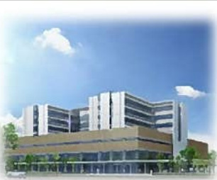
8階建 ベット数は400床

現在、岡崎市民病院では、年間9,000台を超える救急搬送が集中し、幸田町及び岡崎市南部では、年間約2,000人が、市町外の病院に救急搬送されています。新病院は質の高い救急医療を提供します。場所は、JR岡崎駅から徒歩約10分。総建設費は200億円。両市町負担金50億円のうち、新年度、幸田町は約7億7,500万円を負担する予算案を計上。