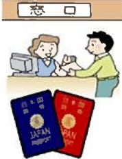
「役場ですべて手続きができます」

愛知県から、旅券事務を市町村への権限移譲することとなり、申請者の戸籍が当該市町村内にある場合、旅券申請に必要な戸籍謄本又は抄本の取得と旅券の申請が同時に可能となり、便利になります。