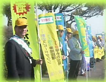
「安全なまちづくり運動」

幸田町内では、過去 3年3か月死亡事故 ゼロが続いてきたが、 10.11月に死亡事故 が2件発生しました。 交通安全施策の推 進強化をすすめたい。