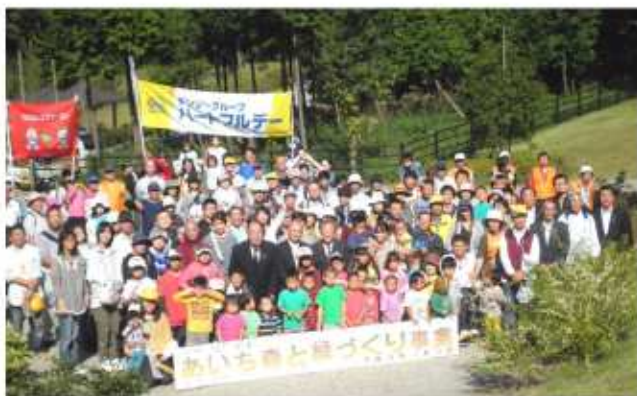
「デコウォーク」参加者集合！

10月21日(日)「あいち森と緑づくり事業デコウォーク」がデンソー幸田製作所と幸田町の共催で「あいち森と緑づくり事業DECOウォーク幸田」が、不動ヶ池親水公園で開催されました。開会式のあと、記念植樹、花植え、公園整備を家族、地域、ボランティアの方々で手分けしおこない気持ちの良い汗をかきました。