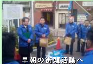
早朝の街頭活動へ

2月1日早朝、連合愛知三河中地域協議会の役員と組織内議員が東岡崎駅駅頭で「働くことを軸とする安心社会の実現」街頭行動を実施しました。