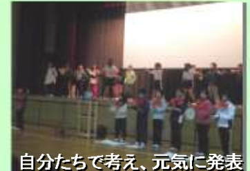
自分たちで考え、元気に発表

2月2日、荻谷小4年生の「Eトークセッション」に参加。アイツ精機(株)内「さわやかふれあいセクター」の青少年育成支援と地域密着活動の積極的取り組みの一環です。