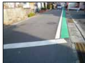
整備される通学路(グリーンベルト化)