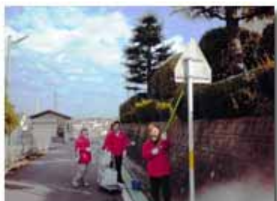
標識もホコリまみれ