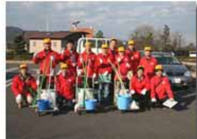
参加者のみなさん「お疲れ様！」