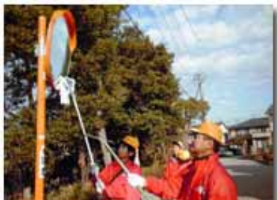
ブラシ水洗い→ヘラ→モップの順に

デンソー幸田製作所の従業員が自主的に町内のカーブミラーの汚れを拭き、ごみも拾いながら3コースに分かれて回りました。通行される方たちから「ご苦労様」と声をかけていただき、磨く腕にも力が入り額に汗が出ました。参加者の皆さん、お疲れ様でした。